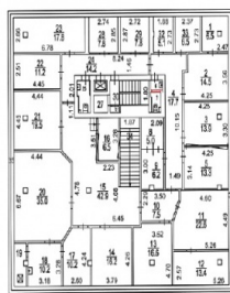
417,2 кв. м., h = 3,4 м.