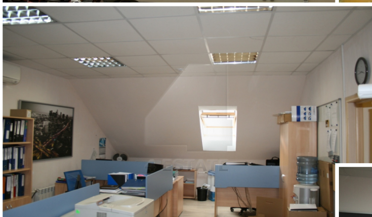
Планировка 1-3 этажей и мансарды - стандартные