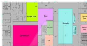
План 2-го этажа