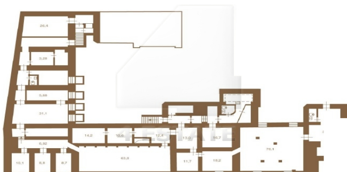
Поэтажные планы (строение 3-6) 2 этаж, чердак

• Общая площадь - 559 м 2 (2 этаж - 482,7 м 2 + чердак - 76,3 м 2 )