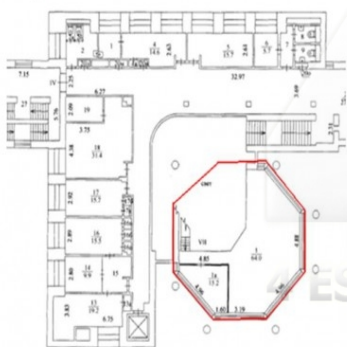
4 этаж корпус Г