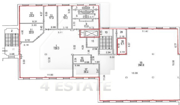
План 4 этажа