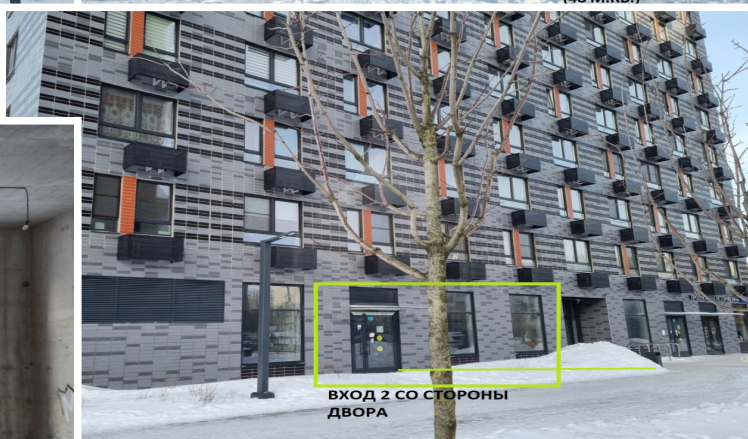
ВХОД 2 СО СТОРОНЫ ДВОРА