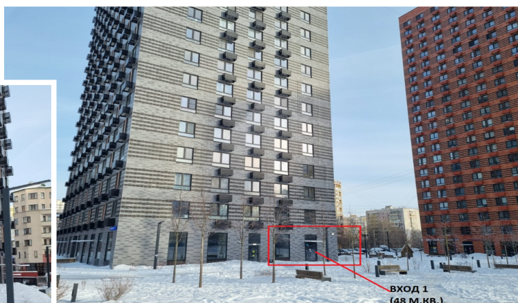
ВХОД 1 (48 М.КВ.)