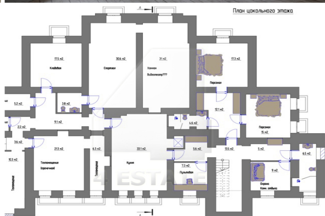
План цокольного этажа