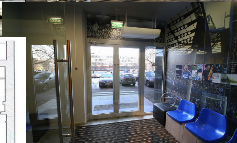
1 этаж 200 кв.м.