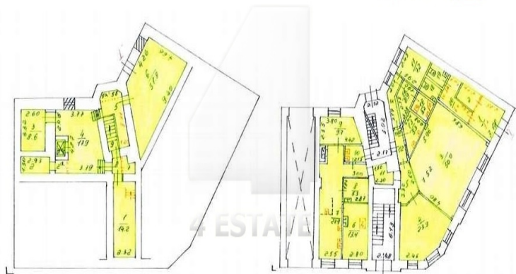
1-ый этаж 223 кв.м.