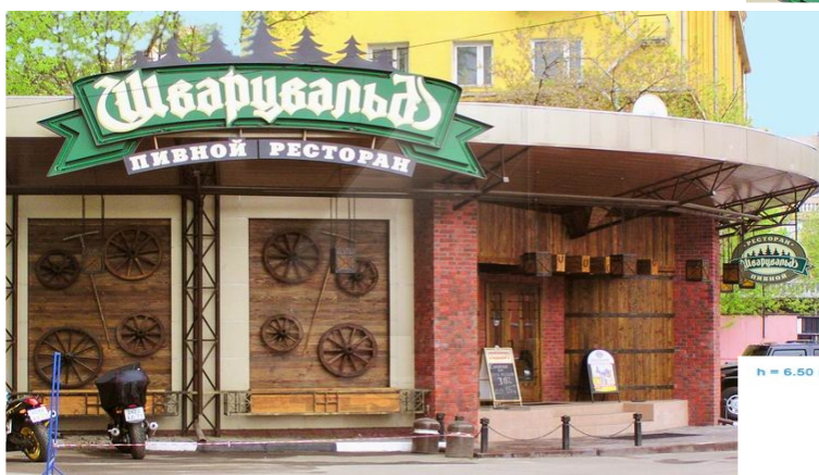
h = 6.50 м