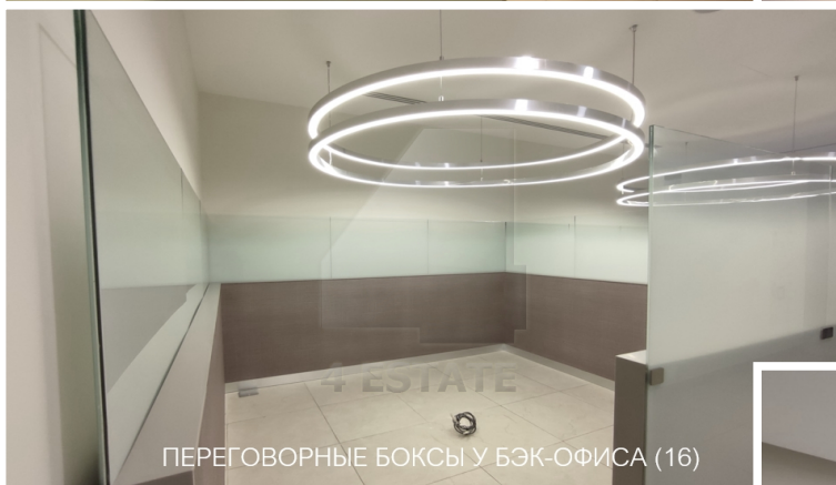
ПЕРЕГОВОРНЫЕ БОКСЫ У БЭК-ОФИСА (16)