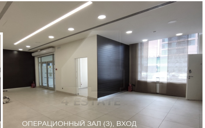
ОПЕРАЦИОННЫЙ ЗАЛ (3), ВХОД