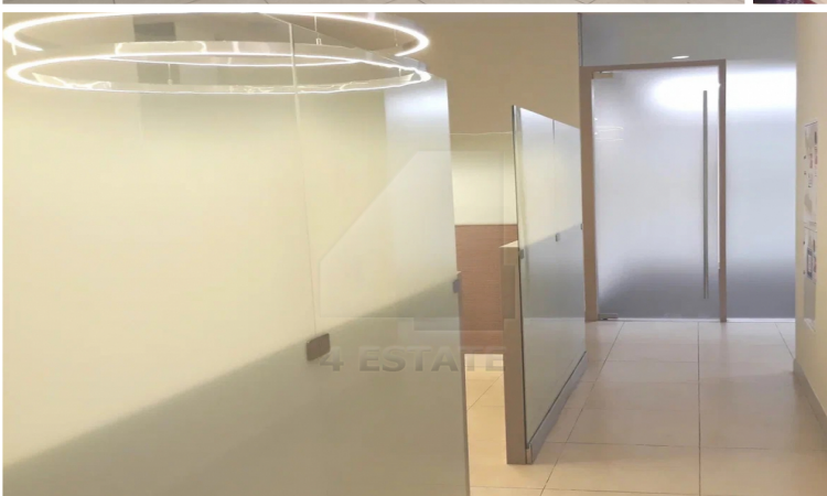
ВИД НА СЕЙФОВУЮ (7), КАБИНЕТ (2), ЗАПАСНОЙ ВЫХОД