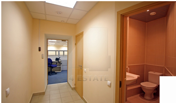
2 И ЭТАЖ