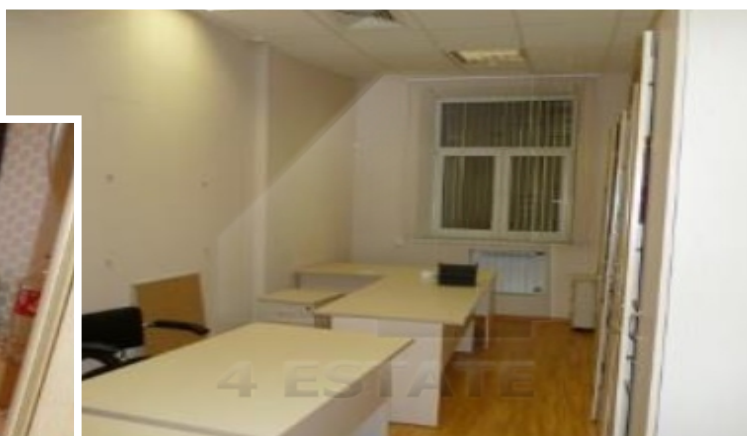
4 корпус 1- этаж