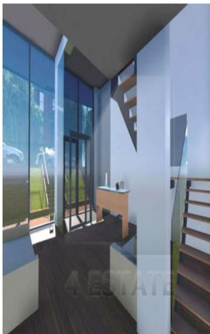
Вариант объемно-планировочного решения