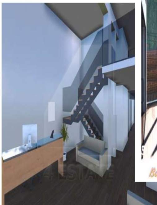
Вариант объемно-планировочного решения