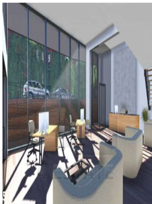
Вариант объемно-планировочного решения