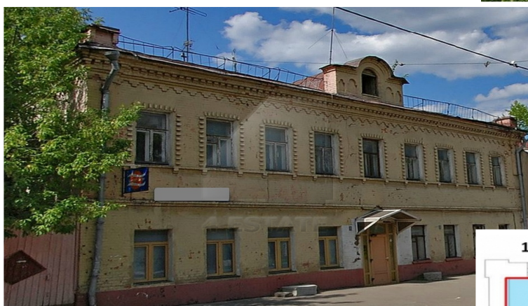
2 этаж, Стр-1.