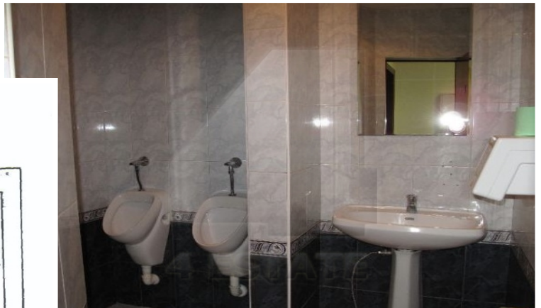
2 й ЭТАЖ