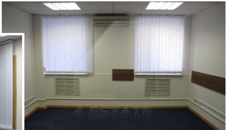
1 й ЭТАЖ