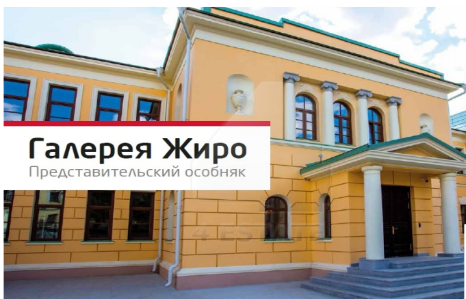
Галерея Жиро Представительский особняк