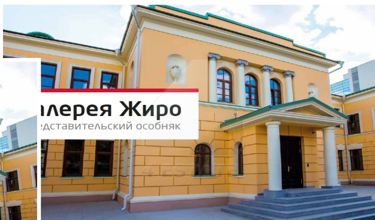
Галерея Жиро Представительский особняк