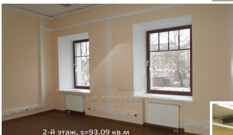
2-й этаж, s=93,09 кв.м