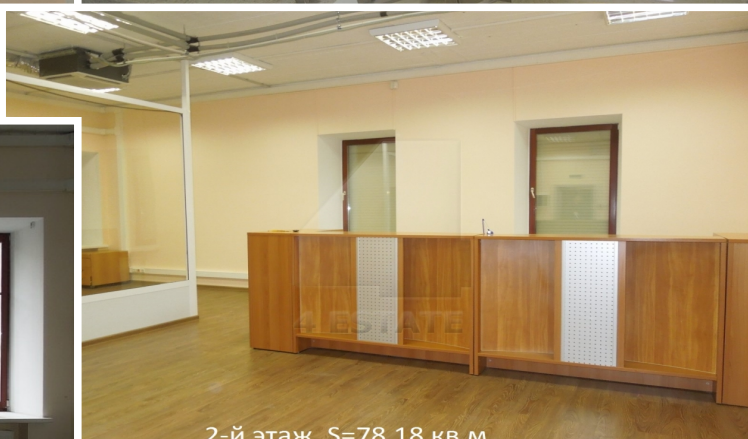
2-й этаж, S=78,18 кв.м