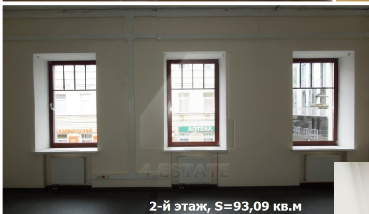
2-й этаж, S=93,09 кв.м