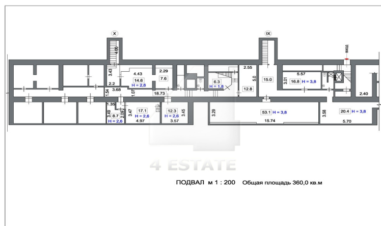
ПОДВАЛ м 1 : 200 Общая площадь 360,0 кв.м