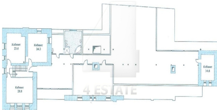
Вариант планировки мезонина