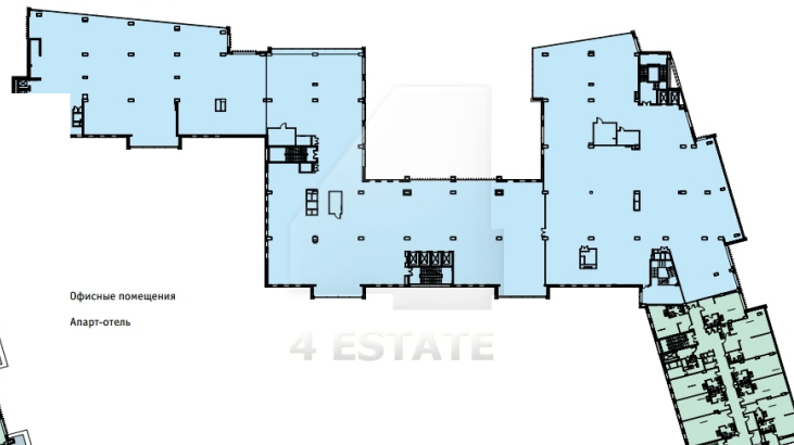
ПЛАН 3 ЭТАЖА