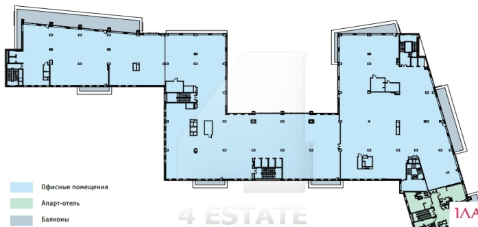
ПЛАН 4 ЭТАЖА