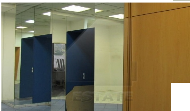
Этаж 1 (S=246,6 кв.м., h = 3,95)