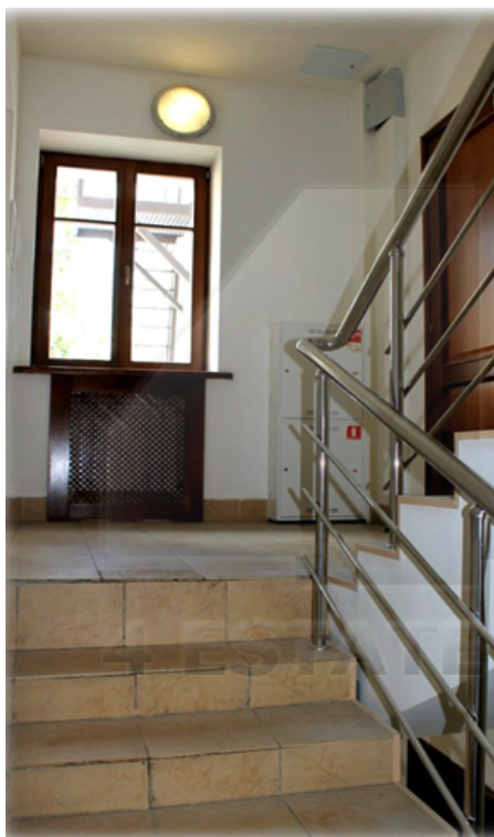
Цоколь - 212 кв.м.